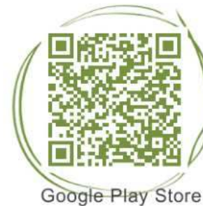
Google Play Store

Sie zeigt dir die nächsten Haltestellen und weiß dank Echtzeit-Daten auf die Minute genau, wann der nächste Bus oder Zug auch tatsächlich kommt. Einfach Standort freigeben und lotsen lassen! Als App oder WebApp immer dabei!